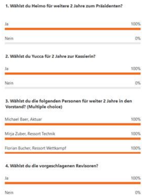
Abbildung 1: Abstimmungsergebnis der Online-Wahlen für die Vorstandsämter und der Revisoren

Die Wahlen finden auch mittels einer Online-Abstimmung statt. Alle Personen werden wie vorgeschlagen einstimmig in den Vorstand gewählt. Ebenso werden die Revisoren einstimmig gewählt.